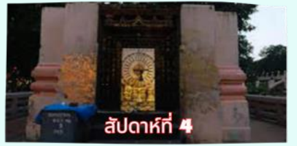
สัปดาห์ที่ 4 รัตนขรเจดีย์ (ซุ้มเรือนแก้ว)

เรียบร้อยแล้ว นำคณะจาริกบุญสวดมนต์ทำวัตรเย็น บูชาพระรัตนตรัย และสวดมนต์บูชาสังเวชนียสถาน จากนั้นเชิญท่านทำศนาธรรม นั่งสมาธิปฏิบัติบูชาตามอัยาศัย สมควรแก่เวลา นัดหมายเวลาเชิญท่านกลับโรงแรมที่พัก