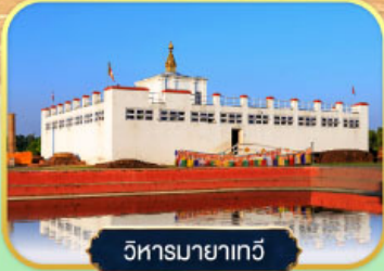
วิหารมายาเทวี