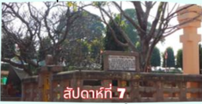
สัปดาห์ที่ 7 ราชายณะ (จำลอง)