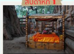
สัปดาห์ที่ 1 พระแท่นวิฆโรอาสน์