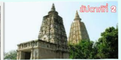
สัปดาห์ที่ 2 อนิมิสเจดีย์