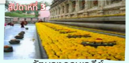
สัปดาห์ที่ 3 รัตนงกรมเจดีย์