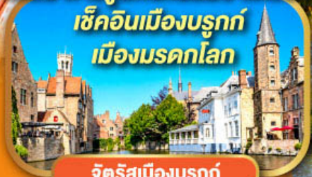
จัตุรัสเมืองบรูคซ์