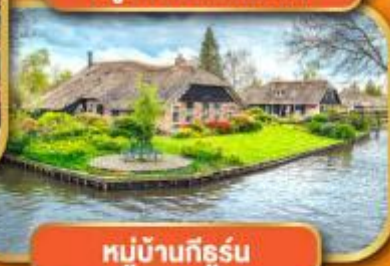
หมู่บ้านก็ธูร์น