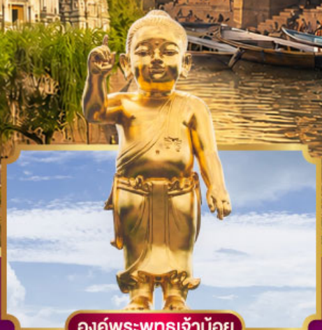
องค์พระพุทธรูปเจ้าน้อย