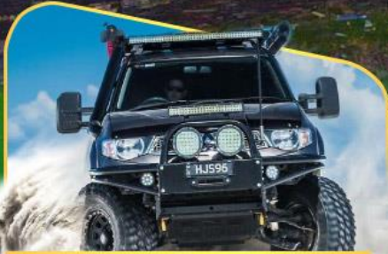
ขึ้นรถ 4WD สู่วังกลางเทือกเขาคอเคซัส