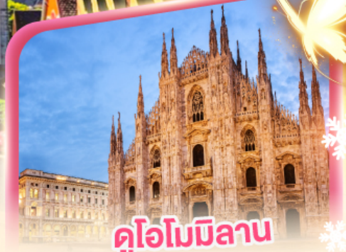
ดูโอโมมิลาน