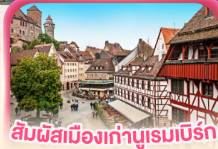
สัมผัสเมืองเก่าบูร์ก