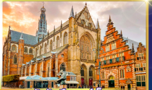
จัตุรัสเมืองฮาร์เล็ม

พรมแดนเมืองเปลกาเนอร์แลนด์และเบลเยียม เดินเมืองเคลฟท์ เมืองเครื่องปั้นดินเผาระดับโลก ฮาร์เล็มเมืองมั่งคั่งที่สุดของเนเธอร์แลนด์