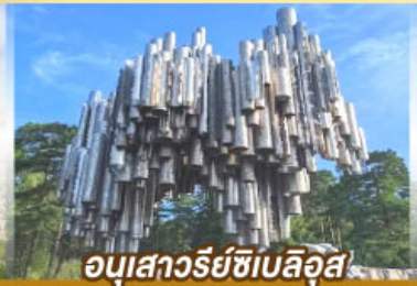
อนุสาวรีย์ซีเบลึส