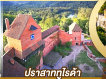
ปราสาทกูไรดา