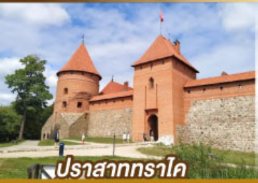
ปราสาททราไค