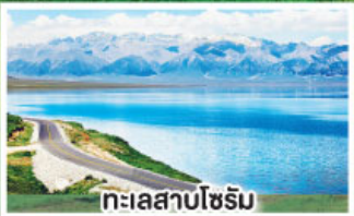
ทะเลสาบไซรัม