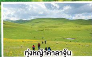
ทุ่งหญ้าคาลาจัน