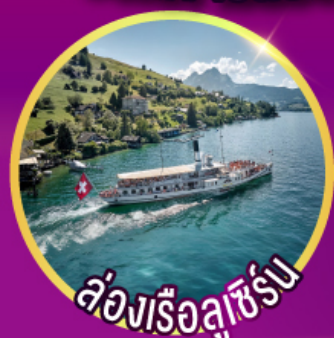
ล่องเรือลูซิิร์น