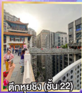
ตึกหุ่ยซิง (ชั้น 22)