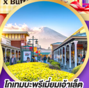
โทกามะ-พรีมียมเอ้าลิต