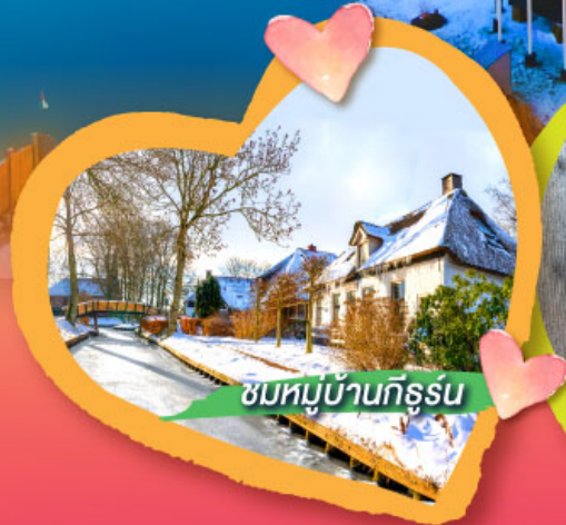
ชมหมู่บ้านกิธูร์น