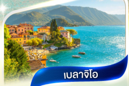
เบลลาจีโอ