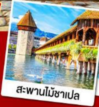
สะพานไม้ซาเปลา