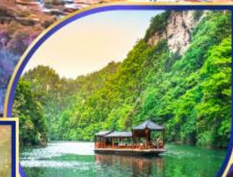
ทะเลสาบเป่าเฟิ่งหู