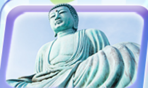
พระใหญ่อโอบุตสึ