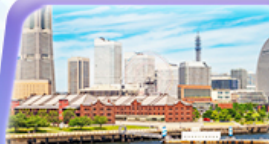
ทิวทัศน์อ่าวโยโกฮาม่า