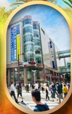
ช้อปปิ้งย่านเกินจิน