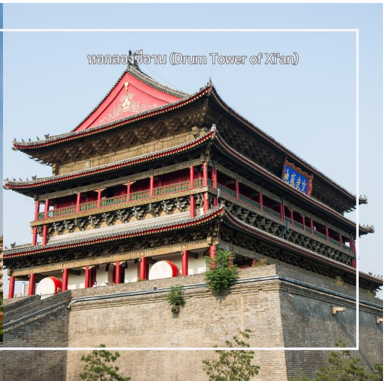
หอกลองซีอาน (Drum Tower of Xi'an)

เที่ยง รับประทานอาหารเที่ยง ณ ภัตตาคาร (มื้อที่ 9) เมนูพิเศษ : สุกี้