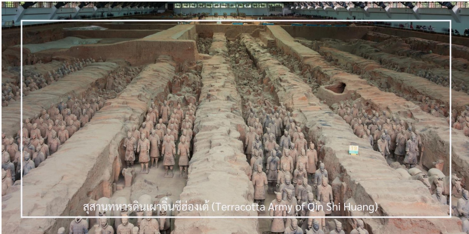
สุสานทหารดินเผาจีนซีฮ่องเต้ (Terracotta Army of Qin Shi Huang)

หลังอาหารนำท่านเดินทางสู่ สุสานทหารดินเผาจีนซีฮ่องเต้ (Terracotta Army of Qin Shi Huang) ใช้เวลาในการเดินทางประมาณ 1 ชั่วโมง ที่นี่คือหนึ่งในสิ่งมหัศจรรย์ของโลกยุคโบราณและแหล่งโบราณคดีที่สำคัญที่สุดของจีน ตั้งอยู่ใกล้เมืองซีอาน มณฑลส่านซี ค้นพบโดยบังเอิญในปี ค.ศ. 1974 ก่อนจะได้รับการขึ้นทะเบียนเป็นมรดกโลกโดยยูเนสโกในปี ค.ศ. 1987 ภายในเป็นสุสานของ “จีนซีฮ่องเต้” จักรพรรดิองค์แรกของจีนผู้รวบรวมแผ่นดินเป็นหนึ่งเดียวในยุคราชวงศ์ฉิน ครอบคลุมพื้นที่หลายหมื่นตารางเมตร แบ่งเป็น 3 หลุม ซึ่งภายในมีทหารดินเผากว่า 8,000 ตัว ที่ถูกสร้างขึ้นอย่างประณีต มีใบหน้า ท่าทาง และเครื่องแต่งกายแตกต่างกันไป พร้อมด้วยรถศึก ม้า และอาวุธโบราณ ที่วางเรียงรายอย่างเป็นระเบียบในหลุมฝังศพ เพื่อปกป้องจักรพรรดิในชีวิตรหลังความตาย