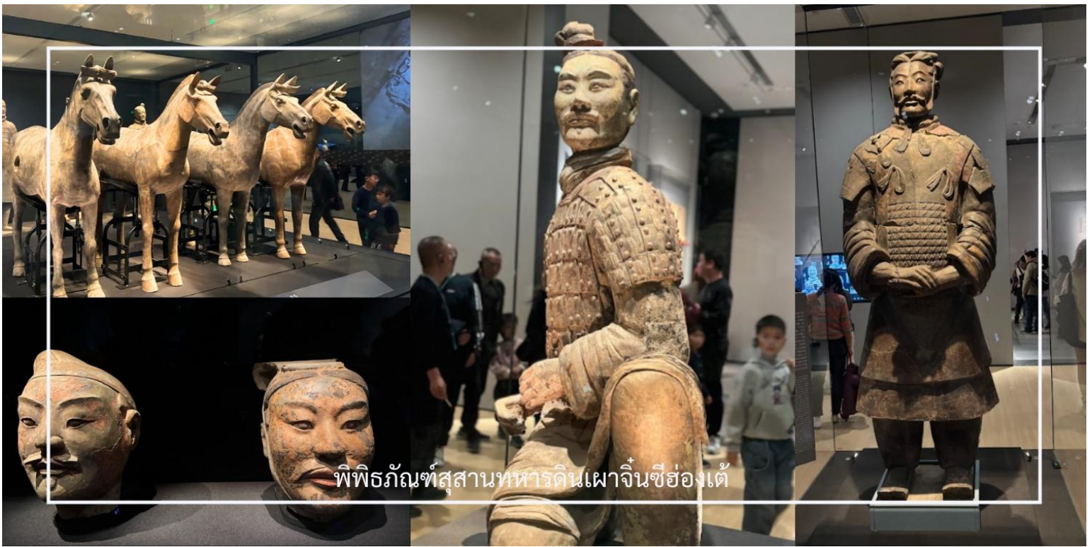
พิพิธภัณฑ์สุสานทหารดินเผาจีนซีอองใต้

สมควรแก่เวลา นำท่านเดินทางสู่ เมืองซีอาน (Xi'an) ใช้เวลาเดินทางประมาณ 1 ชั่วโมง เมืองหลวงเก่าแก่ของมณฑลส่านซี และเป็นหนึ่งในเมืองประวัติศาสตร์สำคัญของจีน ที่เคยเป็นเมืองหลวงของหลายราชวงศ์ เช่น ฉิน อั่น และถัง จึงเต็มไปด้วยเรื่องราวทางประวัติศาสตร์และโบราณสถานสำคัญมากมาย