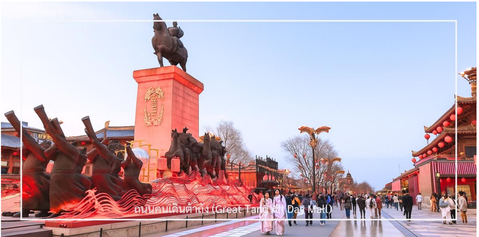
ถนนคนเดินต้าถั่ง (Great Tang All Day Mall)

ในช่วงค่ำจะมีการแสดงตามจุดต่าง ๆ ตลอดแนวถนน ทั้งการแสดงดนตรี การรำแบบจีน และโชว์แสงสีที่ช่วยเพิ่มความคึกคักให้กับบรรยากาศยามค่ำคืน หรือจะเช่าชุด ฮั่นฝู แต่งตัวถ่ายรูป เดินเล่นภายในถนนคนเดิน ให้ความรู้สึกเหมือนได้ย้อนเวลากลับไปในยุคราชวงศ์ถังอีกครั้ง