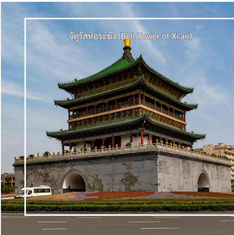
จัตุรัสหระฆัง (Bell Tower of Xi'an)

จากนั้นนำท่าน ผ่านชมจัตุรัสหอกลองและหระฆังซีอาน (Xi'an Drum & Bell Tower) แลนด์มาร์คสำคัญที่ตั้งอยู่ใจกลางเมืองซีอาน และถือเป็นสัญลักษณ์ทางประวัติศาสตร์ของเมืองหระฆังและหอกลองสร้างขึ้นในสมัยโบราณ เพื่อใช้บอกเวลาและส่งสัญญาณเตือนภัยให้กับผู้คนภายในเมือง โดยในอดีตจะตีระฆังในช่วงเช้า และตีกลองในช่วงค่ำ จนได้รับการขนานนามว่าเป็น “ระฆังรุ่งอรุณ กลองยามค่ำ” ปัจจุบันสถานที่แห่งนี้ยังคงได้รับการอนุรักษ์ไว้อย่างดี และเป็นอีกหนึ่งจุดสำคัญที่นักท่องเที่ยวนิยมมาเก็บภาพบรรยากาศใจกลางเมืองซีอาน