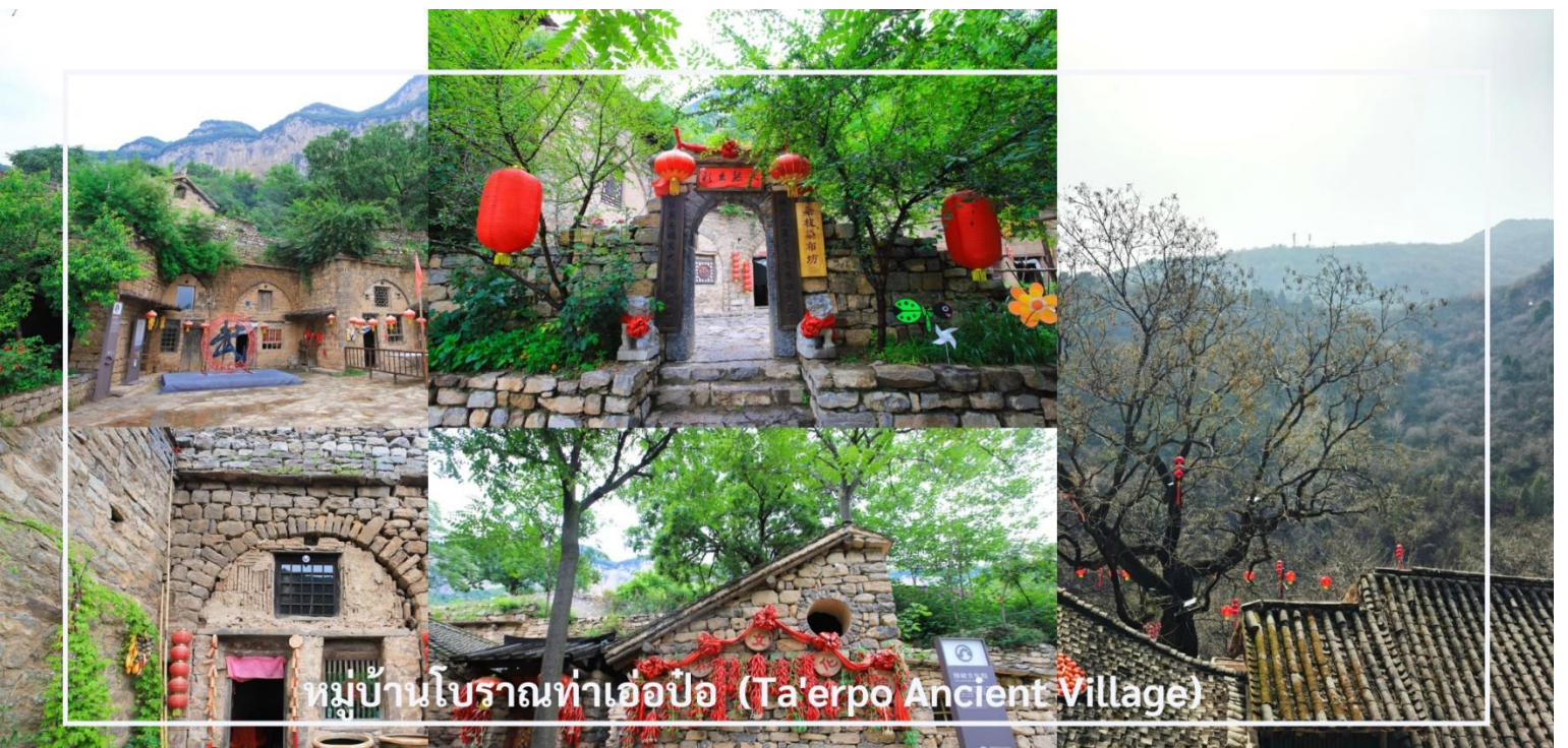
หมู่บ้านโบราณท่าเอ๋อเป้อ (Ta'erpo Ancient Village)

อิสระให้ท่านเดินชมถนนหินภายในหมู่บ้าน ชมบ้านเก่าแก่ที่ยังคงเอกลักษณ์แบบดั้งเดิม แวะถ่ายภาพตามมุมต่าง ๆ และลองชิมขนมพื้นเมืองที่ทำสดใหม่ เช่น เต้าฮู้ร้อน ๆ รวมถึงแวะถ่ายรูปกับประติมากรรมโบราณ ซึ่งเป็นอีกหนึ่งมุมสวยของหมู่บ้านแห่งนี้