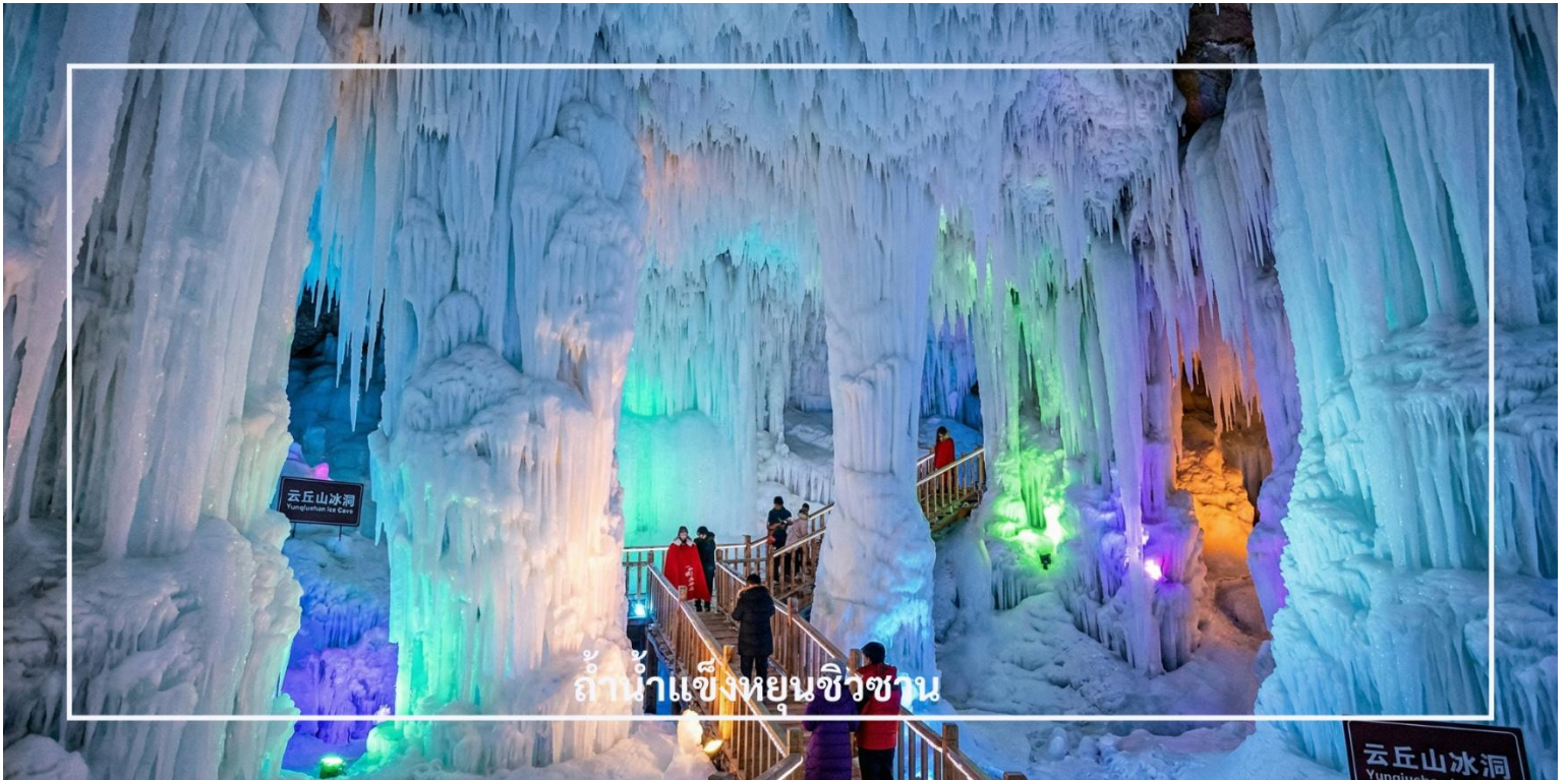
ถ้ำน้ำแข็งหยุนชิวซาน

รูปทรงแปลกตา เปล่งประกายสวยงามภายใต้แสงไฟหลากสี บรรยากาศภายในให้ความรู้สึกราวกับอยู่ในโลกอีกใบ พร้อมอุณหภูมิที่เย็นจัดติดลบตลอดทั้งปี แม้ในช่วงฤดูร้อน ให้ท่านได้เดินชมและเก็บภาพความสวยงามของธรรมชาติที่หาได้ยากแห่งนี้