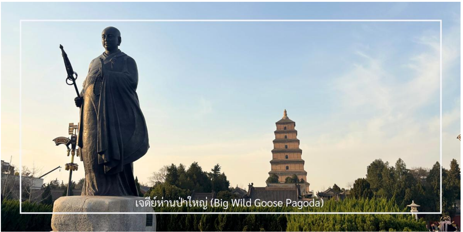
เจดีย์ห่านป่าใหญ่ (Big Wild Goose Pagoda)

นำท่านเดินทางสู่ ถนนคนเดินต้าถั่ง (Great Tang All Day Mall) แลนด์มาร์คยอดนิยมของเมืองซีอาน ตั้งอยู่บริเวณตรงข้ามกับ เจดีย์ห่านป่าใหญ่ ถนนสายนี้ถูกออกแบบให้มีกลิ่นอายของเมืองฉางอันในสมัยราชวงศ์ถัง ตลอดสองฝั่งเรียงรายด้วยอาคารสไตล์จีน ร้านค้า ร้านอาหาร คาเฟ่ และมุมถ่ายรูปรูปมากมาย