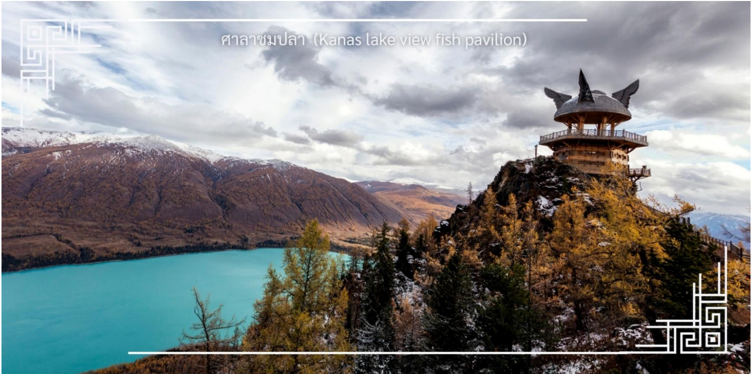
ศาลาชมปลา (Kanas lake view fish pavilion)

หมายเหตุ : การเดินขึ้นศาลาชมปลาจำเป็นต้องใช้กำลังขาพอสมควร ควรเตรียมสภาพร่างกายให้พร้อมก่อนขึ้น