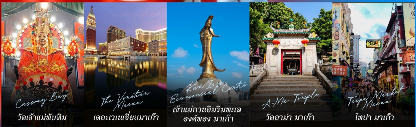
Casway Bay วัดเจ้าแม่ทับทิม

รายการทัวร์ข้างต้นอาจมีการปรับเปลี่ยนเพื่อความเหมาะสม