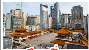
ตึกขุยซิง

พระแกะสลักหินต้าจู้ - หลุมฟ้าสะพานสวรรค์ - เขานางฟ้า ตึกขุยซิง - ตึกตะเกียบ หมู่บ้านโบราณฉือซีโจว