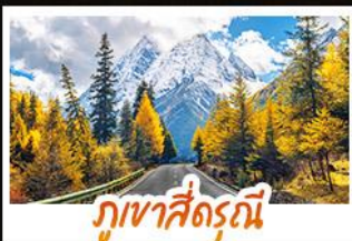
ภูเขาสี่ธรณี

จุดชมวิวน้ำแข็ง 360 องศา "อุทยานต้ากู่ปิงชว่น" • สัมผัสสมมติสนับทึดดูใบไม้เปลี่ยนสี แห่งแดนสวรรค์เสฉวนเหนือ • ชมทะเลสาบหลากสีแห่งที่จิวจ้ายโกว • ช้อปpingจิวจ้ายโกวที่ ถนนคนเดินซุนซีอู่, ถนนโบราณชอยกวางชอยคาบ • นั่งรถไฟความเร็วสูง 17A