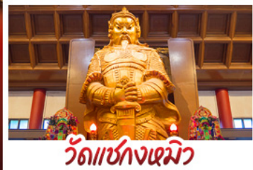
วัดเซกขงหมิว