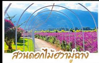
สวนดอกไม้ฮวาปูฉาง