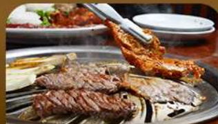
เมนูย่างสไตล์เกาหลี