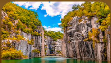
เขื่อนเขาดิกละเมืองโพซอน

ตามหาใบไม้เปลี่ยนสีสุดโรแมนติก ชมวิวเมเปิ้ลหลากสีจากสะพานแขวนรูปตัว Y แห่งเมืองโพซอน สัมผัสความงดงามของโพซอนอาร์ทวอลล์ • เดินเล่นท่ามกลางต้นแปะทิวและเมเปิ้ลในพระราชวังเคียงบกกรุงซมหมู่บ้านอันออกกลางบรรยากาศย้อนยุค และปิดท้ายด้วยทุ่งหญ้าสีทอง ณ สวนฮานิลแลนด์มาร์กยอดนิมของกรุงโซล ในช่วงฤดูใบไม้เปลี่ยนสีที่สวยงามที่สุด