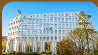
ย่านชองซู