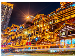
แสงอาคารตั้ง

อุทยานหลุมฟ้าสะพานสวรรค์ • อุทยานเขานางฟ้า • หงหยาดัง • ตึกพวยจิ้ง ชั้น 22 • วัดคำอื้อ ชมรถไฟกะสุติก • สะพานโบราณหนานเฉียว • เมืองโบราณกวางเจี้ยน • อุทยานภูเขาสีดรุณี อุทยานตำกูปิงชาน • จตุรัสหยางเทียนหวู่ • รูปปั้นหมีแพนด้าอนเซลฟี • ร้านหมิงฮ้างซูท้อ ถนนคนเดินซุนซีลู่ • หมีแพนด้าปีนตึก IFS • ถนนไม้ไถ่กุหลาบ • ถนนโบราณชอยกวางชอยแคบ