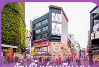
ช้อปบั้งช้านเมียงคง