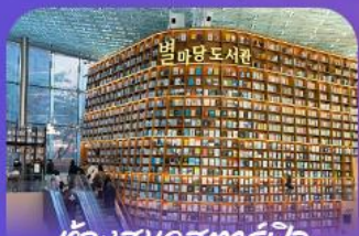
ตึกสมุดคตาร์ฟิลา

เก็บทุกไฮไลท์ในกรุงโซล ตั้งแต่ความงดงามของ พระราชวังเคียงบ็อก ชมวิวสุดอลังการที่ ตึกลิออคเคตี่ โซลสกาย (รวมค่าลิฟต์ขึ้นตึก) สุกสุดมันส์ที่ สวนสนุกลิออคเคตี่ เวิร์ล (รวมค่าบัตรเครื่องเล่น) เพลิดเพลินไปกับโลกใต้ทะเล ลีออคเคตี่ อควาเรียม (รวมค่าบัตรเข้าชม) เขิกอินแลนด์มาร์กสุดฮิตอย่างห้องสมุดสตาร์ฟิลา โคเอกมอลล์ เดินเล่นย่านฮิป นริ๊กสิมกาหลี ซองชุง และช้อปปิ้งซัมเมอร์เซล สูดฟิน ย่านเมืองคงและ-ฮงแด