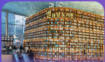
ห้องสมุดสตาร์ฟิลา

เก็บทุกไฮไลท์ ในกรุงโซล ตั้งแต่ความงดงามของ พระราชวังเคียงบ็อก ชมวิวสุดอลังการที่ ดึงลือตเต็ โซลสกาย (รวมค่าลิฟต์ขึ้นตึก) สนุกสุดมันส์ที่ สวนสนุกลือตเต็ เวิร์ล (รวมค่าบัตรเครื่องเล่น) พลิตเพลนไปกับโลกใต้ทะเล ลือตเต็ อควาเรียม (รวมค่าบัตรเข้าชม) เช็กอินแลนด์มาร์กสุดฮิตอย่างห้องสมุดสตาร์ฟิลา โคเอกมอลล์ เดินเล่นย่านฮิป บริกสินทาหลี ซองชุง และช้อปปิ้งซัมเมอร์ซล สูดฟีน ย่านเมืองคงและองเคด