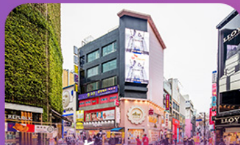
ช้อปปิ้งย่านเมียงดง