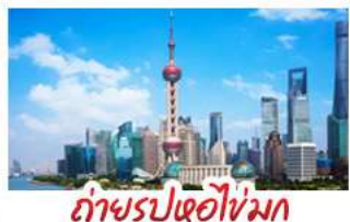
ถ่ายรูปไข่มุก