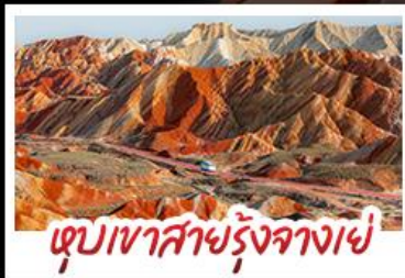
หุบเขาสายรุ้งจางเย่