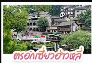
ตรอกเซียวฮ่าวเฉี