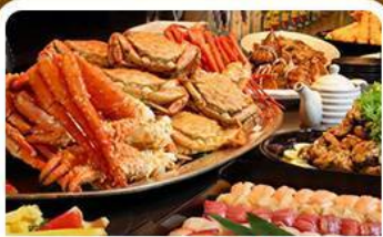
บุฟเฟ่ต์ซาบู+ซาบู 3 ชนิด