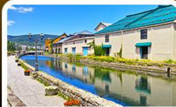
คลองไอตารุ