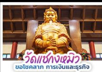
วัดแห่งกงเหมียว ขอโชคกลาง การเงินและธุรกิจ