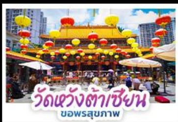
วัดแห่งต้าเซียน บ่อพรสุภภาพ