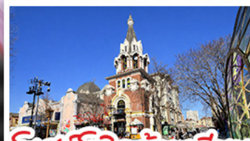
โบสถ์โกธิคต้าเหลียน