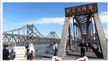
สถานตงต้วนเฉียว