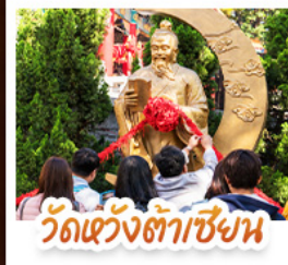
วัดเข่งต้าเซียน