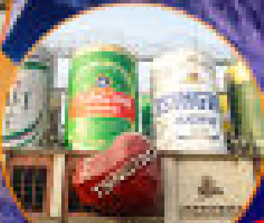
โรงแรมเบียร์ฮาร์บิน