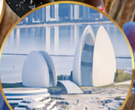
โรงละครหอยโข่มุก