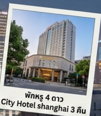
พักรู 4 ดาว City Hotel shanghai 3 คืน

Special Option : ตั๋ว Disneyland + รถรับ-ส่ง เริ่มต้นที่ 3,900 บาท/ท่าน