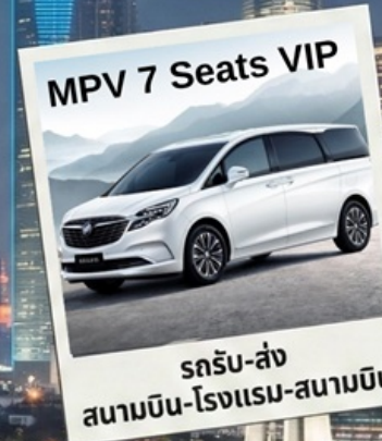
MPV 7 Seats VIP