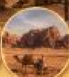
ทะเลทราย