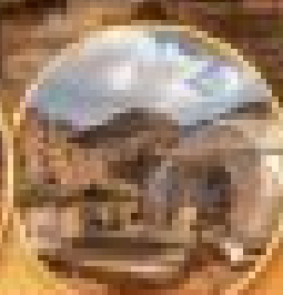
แม่น้ำไนล์และอียิปต์