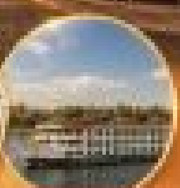
เมืองเปตราจอร์แดน