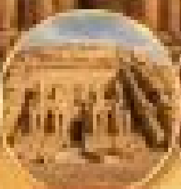
วิหารคาร์นัค