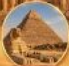
ปิรามิด & สฟิงซ์