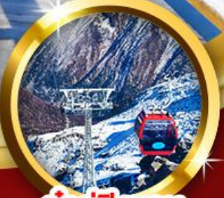
ต่ากู่ปิงชวณ