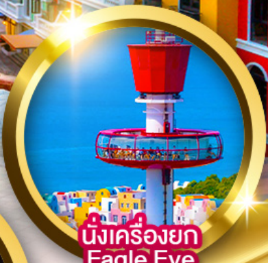
นั่งเครื่องยก Eagle Eye