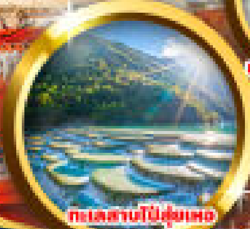
ทะเลสาบป๋าย่ซู่หนง