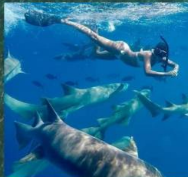
** Nurse Shark Snorkeling