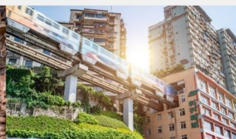
รถไฟฟ้ากะลุ่ตึก

*ทางบริษัทฯ ขอสงวนสิทธิ์ในการสลับโปรแกรมทัวร์ตามความเหมาะสมขึ้นอยู่กับสถานการณ์หน้างาน โดยคำนึงถึงผลประโยชน์ของลูกค้าเป็นสำคัญ