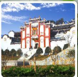
บ้านเกิดชวีหยวน