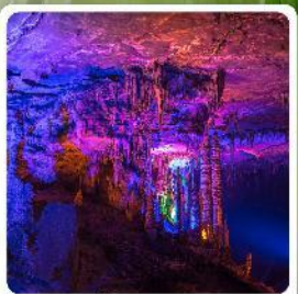
ตำก้ำเทพ