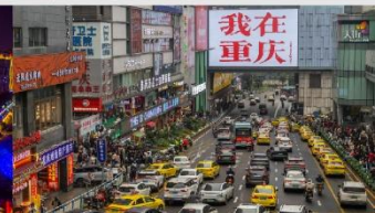
กวนอิมเจียว

*ทางบริษัทฯ ขอสงวนสิทธิ์ในการสลับโปรแกรมทัวร์ตามความเหมาะสมขึ้นอยู่กับสถานการณ์หน้างาน โดยคำนึงถึงผลประโยชน์ของลูกค้าเป็นสำคัญ