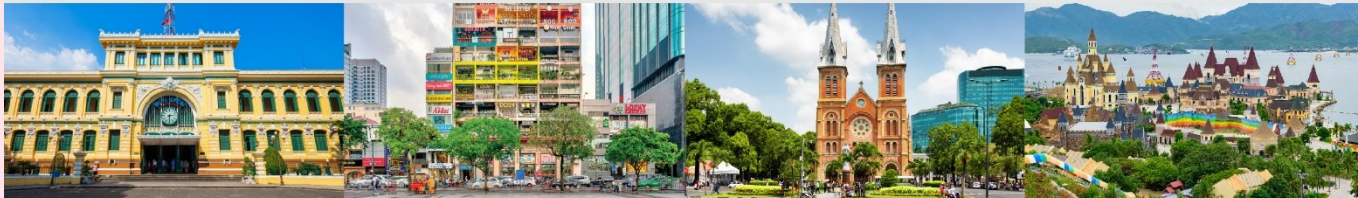
ไพรบิชย์กลางโฮจิมินห์