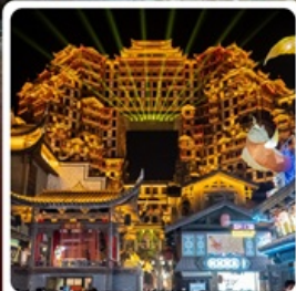
ตีทมหัตจรรย 72