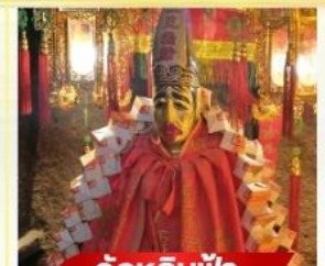
วัตต์หลินฟ้า