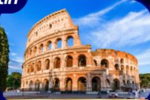
เที่ยวกรุงโรม