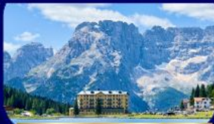
อุทยานฯ โดโลไมท์