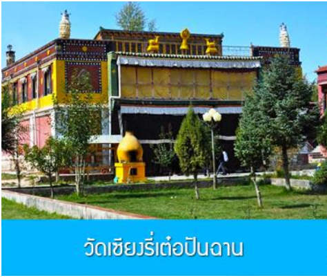
วัดเซียงรีเต๋อป็นฉาน